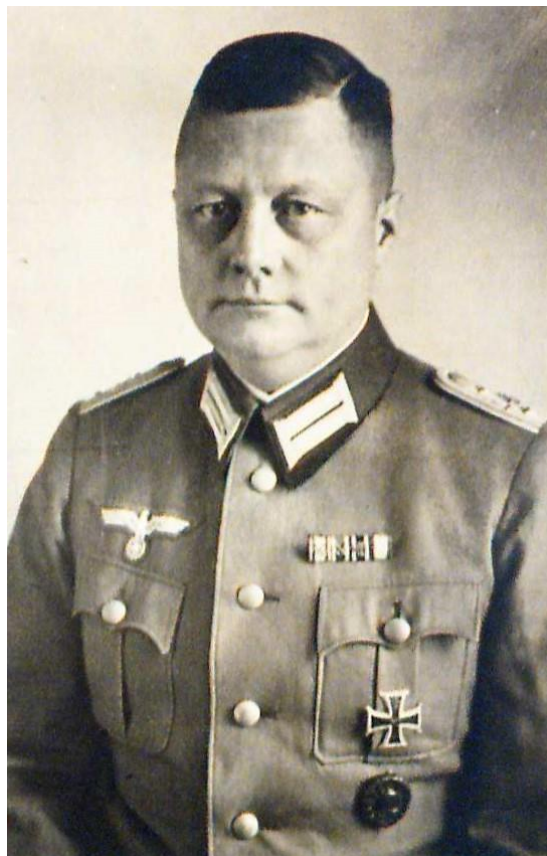
Fot. 6. Walter Borck. Zdjęcie ze zbiorów Archiwum Państwowego w Poznaniu, Wyższy Sąd Krajowy w Poznaniu, sygn. 85, akta personalne.